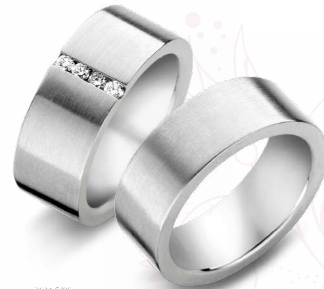
7624-S/85 7623-S/85 100% edelstaal - 100% acier fin