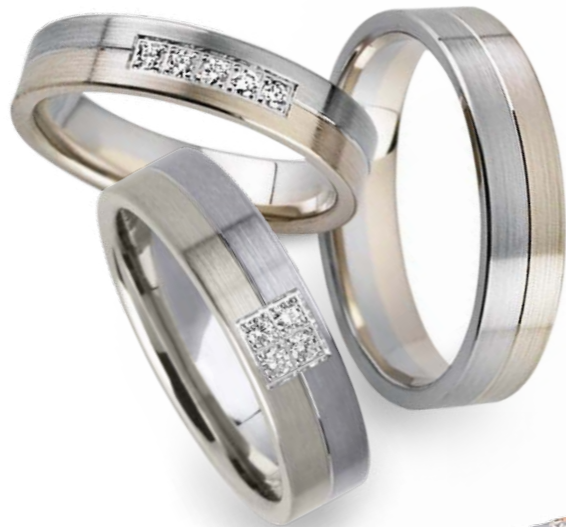
7666-PD/45 7667-PD/50 7665-PD/60