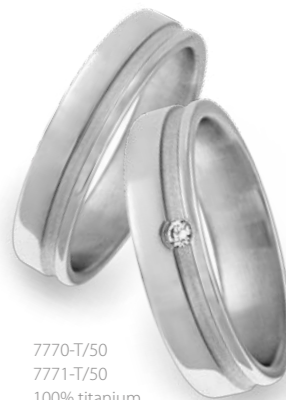
7770-T/50 7771-T/50 100% titanium