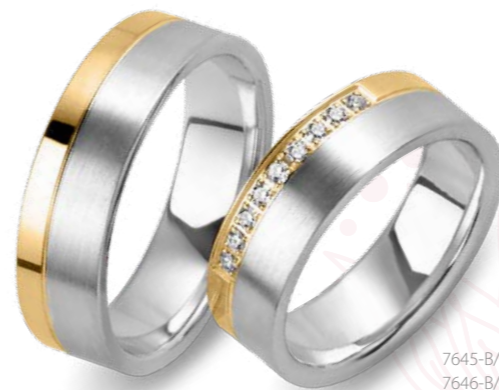
7645-B/63 7646-B/63 Lightweight: 7645-BL/63 7646-BL/63