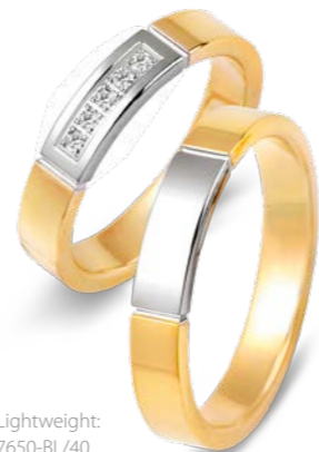
Lightweight: 7650-B/40 7649-B/40 7650-BL/40 7649-BL/40