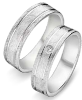
7578-W/60 7579-W/50 Lightweight: 7578-WL/60 7579-WL/50