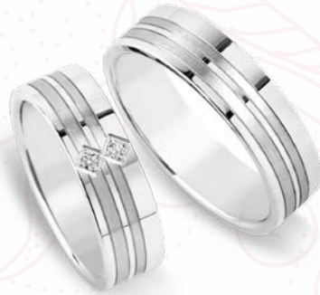
7671-W/60 7670-W/60 Lightweight: 7671-WL/60 7670-WL/60