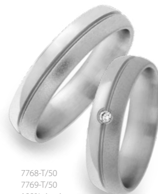
7768-T/50 7769-T/50 100% titanium